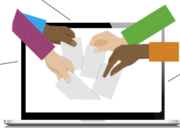
* mêmes données que pour accéder à i-Prof

(pli cacheté remis entre le 5 et le 13 novembre ou réception par mail). Si je perds mon identifiant, je peux en obtenir un nouveau via mon espace électeur ( elections2018.education.gouv.fr ) jusqu'à la clôture du vote.